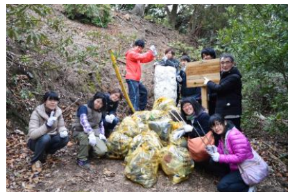
昨年の宮島ボランティア清掃の様子

このたび、本学学生(ピア・サポーター)が、昨年度に引き続き、地域のボランティア活動を通じた仲間づくりや県外出身学生等との交流を目的とし、「宮島ピア・サポート活動」を実施します。この活動では、学科の異なる学生同士や教職員が「世界遺産宮島」についての学びやボランティア活動を通して、活発なコミュニケーションを図り、今後の学生達のキャンパス・ライフが充実することを目指しています。