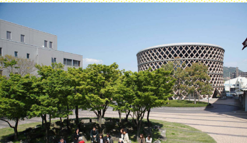
Campus principal (Hiroshima)

Pour plus d'informations veuillez consulter la version anglaise de notre site Internet.