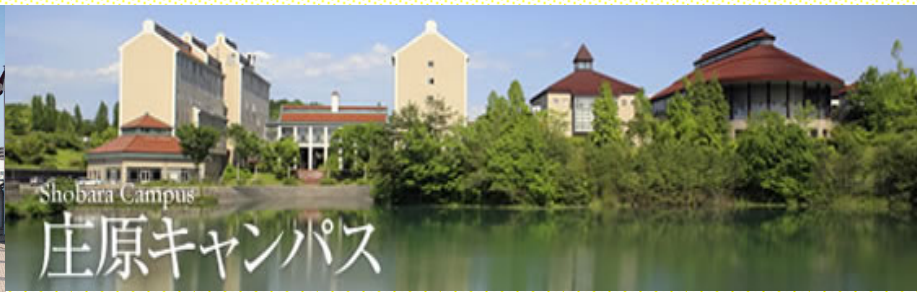
Campus de Shobara