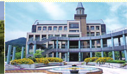
Campus de Mihara