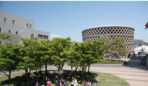
الحرم الرئيسي (هيروشيما)

لمزيد من المعلومات يرجى الاطلاع على النسخة الإنكليزية من الدليل والمتوفرة على موقعنا الإلكتروني.